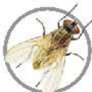
Mosca-doméstica ( Musca domestica )