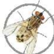
Mosca-dos- Estábulos ( Stomoxys calcitrans )