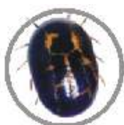
Carrapato ( Boophilus microplus )