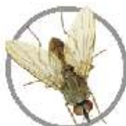
Mosca-do-chifre ( Haematobia irritans )