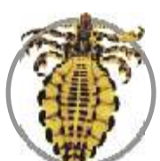
Piolho ( Haematopinus sp )

Concentração: Cipermetrina 5 g; veículo q.s.p. 100 ml