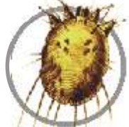
Sarna ( Sarcoptes scabiei )