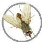
Mosca-do-chifre ( Haematobia irritans )