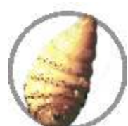
Berne em bovinos ( Dermatobia hominis )