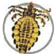
Piolho ( Haematopinus sp. )