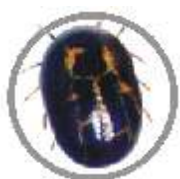
Carrapato ( Boophilus microplus )