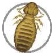
Falso piolho ( Damalínia sp. )