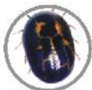
Carrapato ( Boophilus microplus )