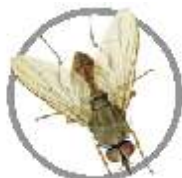
Mosca-do-chifre ( Haematobia irritans )