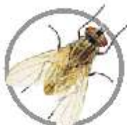
Mosca-doméstica ( Musca domestica )