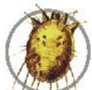
Sarna ( Sarcoptes scabiei )

Formulação: Concentrado Emulsionável (CE)