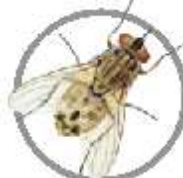
Mosca-dos-Estábulo ( Stomoxys calcitrans )