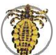
Piolho ( Haematopinus sp )